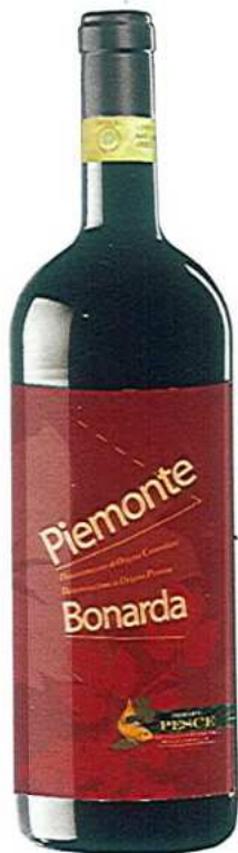
PIEMONTE BONARDA D.O.C. - D.O.P.

Vino caratteristico del Monferrato. Colore rosso rubino, tendente al granata se invecchiato, profumo fruttato dal sapore asciutto e contestualmente di buon corpo e discreta acidità. Bevuto sia giovane che invecchiato, è consigliato per piatti dai sapori decisi. Temperatura 18° - 20°