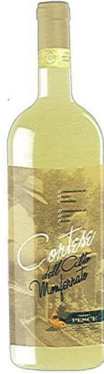
CORTESE DELL'ALTO MONFERRATO D.O.C. - D.O.P.

Di colore rosso rubino chiaro, ottenuto dalla fermentazione in bianco di uve rosse, questo vino presenta la gradevolezza ed il bouquet intenso dei vini appena fermentati, ma anche un sapore corposo tipico. Il deposito che lascerà sul fondo è dovuto al processo di chiarifica che, ottenuto per decantazione naturale, continua anche dopo l'imbottigliamento. Ottimo per aperitivi, pesce e piatti delicati. Servire fresco 10 - 12°