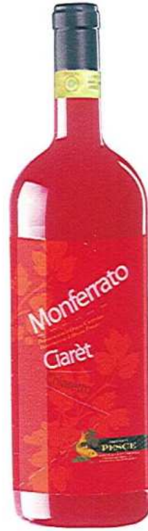
MONFERRATO CIARET - CHIARETTO D.O.C. - D.O.P.

Vino tipico delle Colline Ovadesi. Di colore rosso rubino, asciutto al palato, con retrogusto amarognolo ed un profumo intenso ai frutti di sottobosco e ciliegia. Bevuto giovane, accompagna qualsiasi piatto gustoso e saporito. Si consiglia di servirlo a 15° - 18°