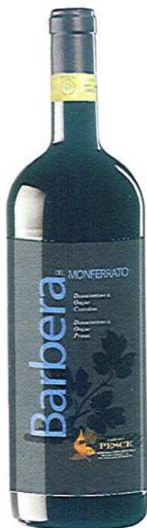
BARBERA DEL MONFERRATO D.O.C. - D.O.P.

Per cui sarà per noi un piacere accogliervi nella nostra azienda e, mentre i vostri contenitori vengono riempiti, passare alcuni minuti con voi in cordialità assaggiando i nostri prodotti magari consumando un frugale spuntino come da tradizione.