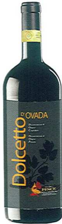
DOLCETTO D'OVADA D.O.C. - D.O.P.

Vino piemontese vinificato in purezza unicamente con vitigno Bonarda. Dal colore rosso intenso, profumo vinoso e speziato, dal gusto leggermente amabile e tannico, è consigliato per accompagnare salumi e carne alla brace. Temperatura 18 - 20°